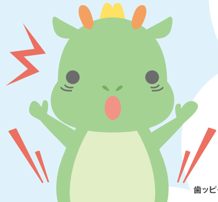
歯ッピーおろちびくん