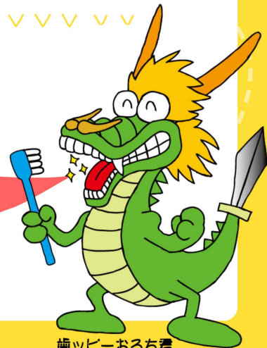
歯ッピーおるち君