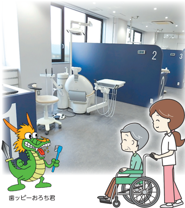
歯ッピーおろち君